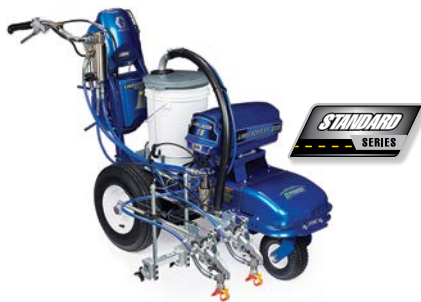
LINELAZER V ES 2000 STANDARD SERIE