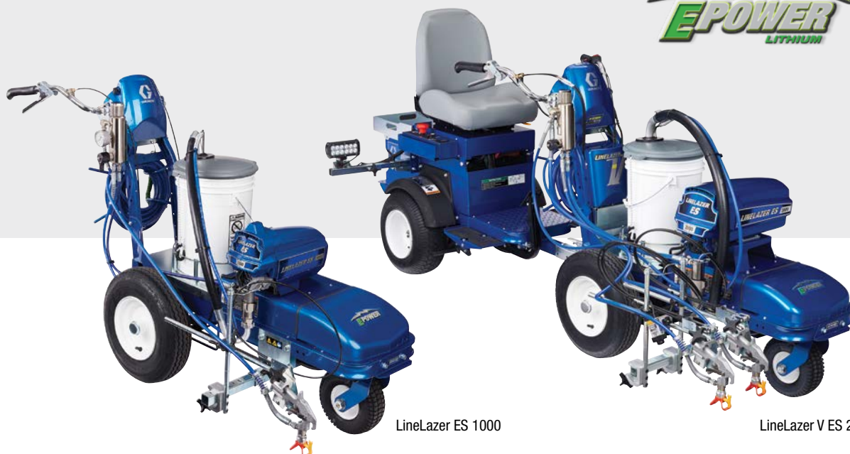
LineLazer ES 1000