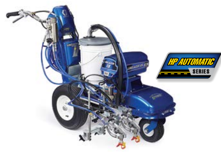
LINELAZER V ES 2000 SERIE HP AUTOMATIC