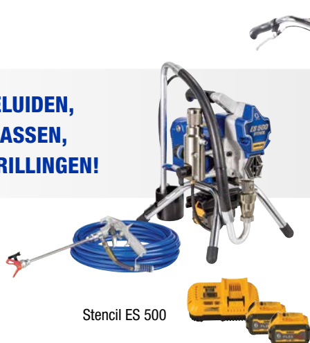
Stencil ES 500

GEEN MOTORGELUIDEN, GEEN UITLAATGASSEN, GEEN MOTOR TRILLINGEN!