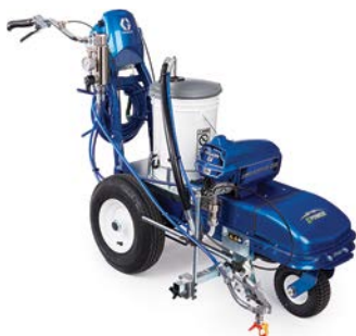
LINELAZER ES 1000