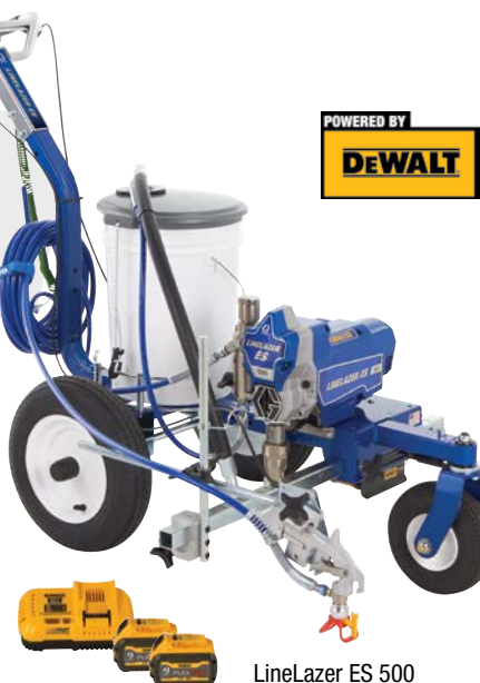
LineLazer ES 500